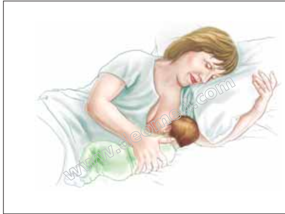
Şekil 3.15: Yatarak emzirme.

Yatarak emzirme: Rahat bir şekilde başınızı sırtınızı yastıkla destekleyerek yan pozisyonda yatınız. Bebeğin vücudu sizin vücudunuza bakacak şekilde bebeği yanınıza yatırın. Bebeği yastıkla veya kolunuzla destekleyerek memeyi kavramasını sağlayın ( bkz. Şekil 3.15 ).