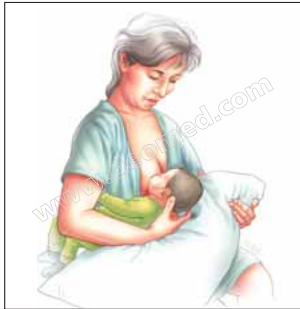
Şekil 3.13: Emzirmede futbol tutuşu.

Futbol tutuşu (koltuk altı pozisyonu): Bebeğinizin bacaklarını koltuk altınızdan dışarı doğru sarkıtın. Bebeğin başını omuzlarınızdan elinizle destekleyin. Bebeğinizin yüzü size dönük olsun. Elinizin altını bir yastıkla destekleyin ( bkz. Şekil 3.13). Bu pozisyon, memeleri büyük olan, ikiz, bebekleri olan, prematüre ve zayıf bebeği olan annelerin tercih edecekleri bir pozisyonudur.