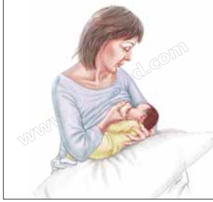
Şekil 3.12: Emzirmede beşik tutuşu.

Futbol tutuşu (koltuk altı pozisyonu): Bebeğinizin bacaklarını koltuk altınızdan dışarı doğru sarkıtın. Bebeğin başını omuzlarınızdan elinizle destekleyin. Bebeğinizin yüzü size dönük olsun. Elinizin altını bir yastıkla destekleyin ( bkz. Şekil 3.13). Bu pozisyon, memeleri büyük olan, ikiz, bebekleri olan, prematüre ve zayıf bebeği olan annelerin tercih edecekleri bir pozisyonudur.