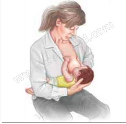
Şekil 3. 14: Emzirmede çapraz beşik tutuşu.

Çapraz beşik tutuşu: Bebeği emzireceğiniz memenin aksi taraftaki kolunuz üzerine bebeği yatırın. Baş ve omuzlarını avuç içinizle kavrayın. Vücudu sizin vücudunuza dönük olarak emzirin ( bkz. Şekil 3.14 ). Bu pozisyon bebeğinizin başını daha kolay kontrol etmenizi sağlar.