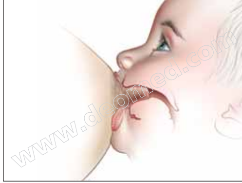
Şekil 3.10: Bebeğin meme ucunu areola ile birlikte alması.