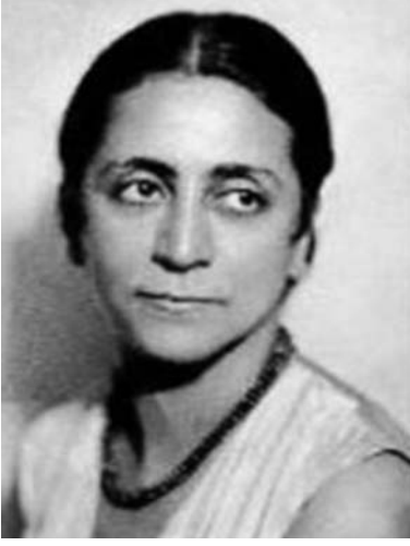
Şekil 31.4. Dr. Safiye Ali (1891-1952).