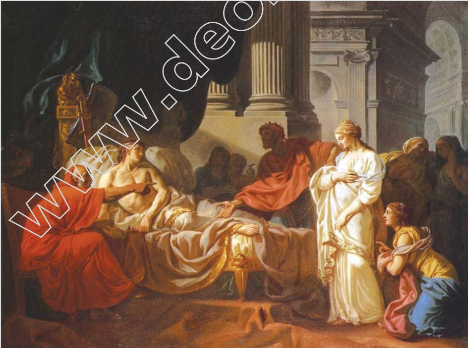
Şekil 16.5. "Antiochus ve Kraliçe Stratonice" (Jacques-Louis David, 1774; École des Beaux-Arts, Paris, Fransa).

Hikaye şöyledir: Antikos çok ciddi hastadır, hiçbir doktor hastalığa çare bulamamıştır. Dönemin İskenderiye'de çalışan en ünlü doktorlarından Koslu Erasistratus saraya davet edilir. Erasistratus hastanın nabzını muayene ederken birden nabzın çok hızlandığını, hastanın huzursuz olmaya başladığını, kızardığını ve terlediğini fark etmiş. Kalbi yerinden çıkacak gibi olan, bulantısı başlayan, panik içinde görülen bir genç adam yatakta öylece yatmaktaymış. Bu durum ve bulgular hastayı muayene ettiği saatler içinde birkaç kez tekrarlamış. Erasistratus çok iyi bir gözlemlerle bu bulguların yaşlı kralın karısı olan genç ve güzel bir kadının, Kraliçe Stratonice 'nin odaya girmesi ile eş zamanlı olduğunu fark etmiş. Kraliçe odadan çıktıktan kısa bir süre sonra Antikos normale dönüyormuş. Erasistratus hastalığın fiziki değil ruhsal olduğunu saptamış. Yani bugünün tanımıyla " psikosomatik hastalık " tanısı koymuş. Oğlunun tedavisi için Kral'a karısını oğluna vermesini önermiş. Baba da oğlunun tedavisi için eşini, oğlunun üvey annesini oğluna vermiş. Bundan sonra Stratonice ile Antikos evlenmişler ve kısa bir süre sonra da Kral tahtını oğluna bırakmış. Antikos ise uğruna babasını kaybettiği güzeller güzeli karısının adına bir kent kurmuş.