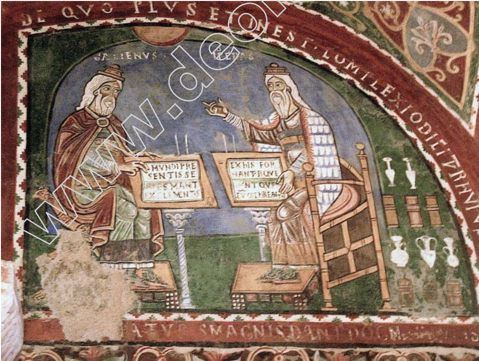
Şekil 16.4. Solda Galen ve karşısında Hipokrat. İtalya'da Anagni Katedrali'nde bir fresk (1231; Anagni, Lazio, İtalya).

Roma Tıbbı'nda hekimlere ayrıcalıklar tanınmıştır.